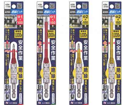
AZM-1100 AZM-1150 AZM-2100 AZM-2150