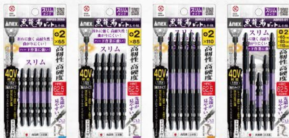
ABRSS5-2065 ABRSS5-2085 ABRSS5-2110 ABRSS5-01