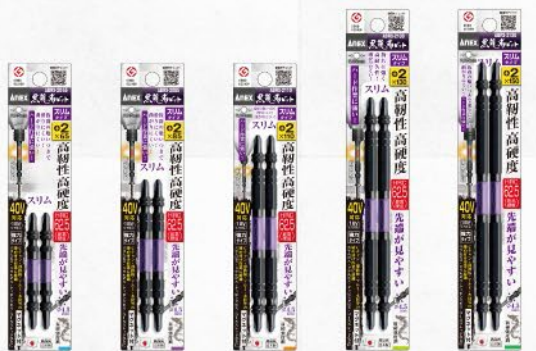
ABRSS-2065 ABRSS-2085 ABRSS-2110 ABRSS-2130 ABRSS-2150