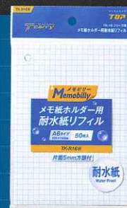
耐水紙リフィル(50枚入) TK-R16W

メモ紙ホルダー用 耐水紙リフィル(50枚入) TK-R16W 寸法(mm): 高さ148×幅105 製品重量: 50g 標準価格: 500円