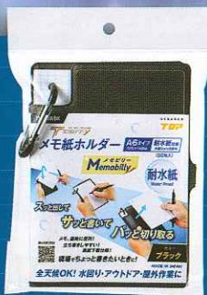
ブラック(耐水紙仕様) TK-16WBK

メモビリー(ブラック) 耐水紙仕様 TK-16WBK 寸法(mm): 高さ160×幅110×奥行15 製品重量: 130g 標準価格: 2,100円