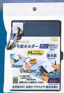
ネイビー(耐水紙仕様) TK-16WNB

メモビリー(ネイビー) 耐水紙仕様 TK-16WNB 寸法(mm): 高さ160×幅110×奥行15 製品重量: 130g 標準価格: 2,100円