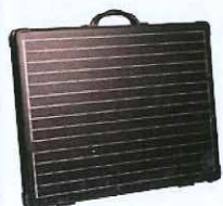
BA-SP120BS 120W 防水ソーラーパネル