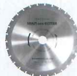
マルチエコカッター