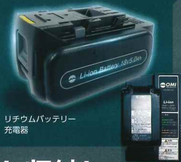
リチウムバッテリー 充電器