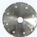
DDP (塩ビ管用電着ダイヤモンドカッター)