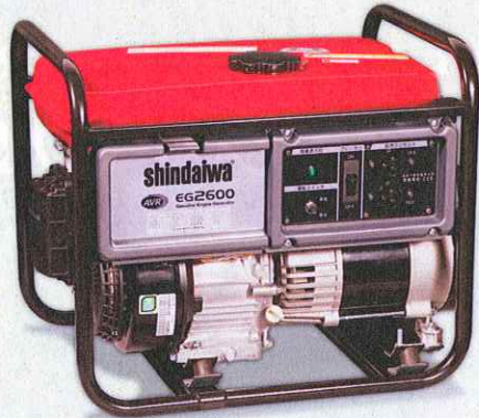
EG2600 50Hz:EG2600-A 60Hz:EG2600-B ¥181,500(税込)(税抜価格¥165,000)