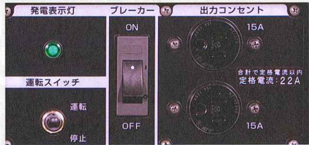
※写真は50Hzタイプです。60Hzタイプの定格電流は26Aです。